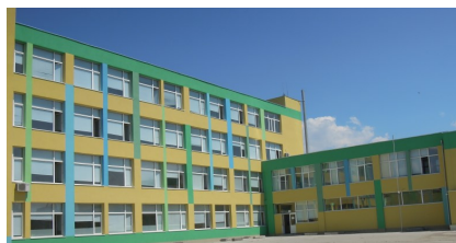
ПГИ „ИВАН ИЛИЕВ“